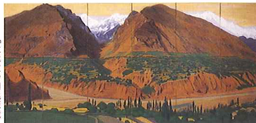
「大毗波沙国桃源境」 呉市立美術館蔵

《広島生変図》《受胎靈夢》(広島県立美術館蔵)、《大毗波沙国桃源境》(呉市立美術館蔵)《エジプトの少女(王家の谷ルクソール)》(ウッドワン美術館蔵)など、広島県内で見ることができる作品を通して、平山絵画の魅力を紹介します。