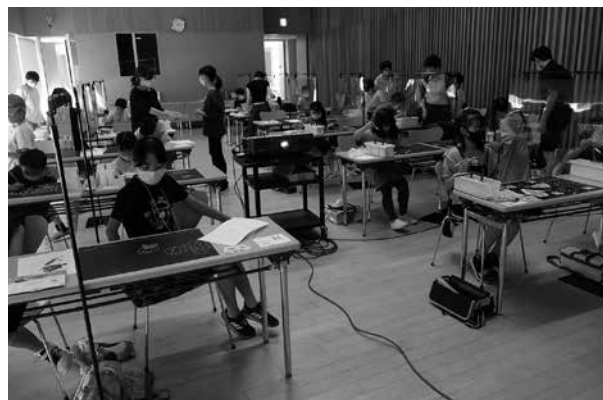
こどものアトリエ