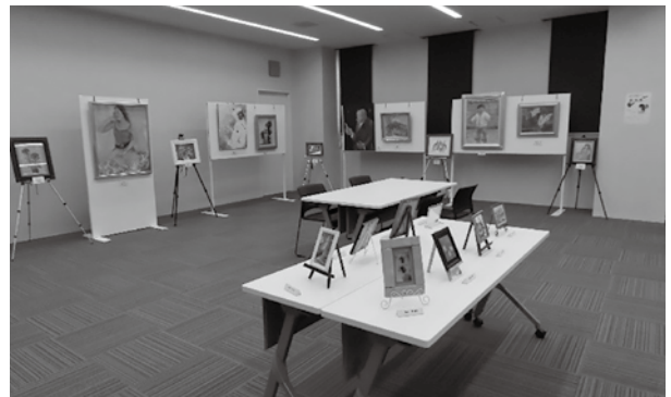
海田町文化祭兼公民館まつり ステージ部門及び展示部門